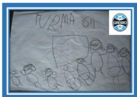
Eu e meus colegas

Na escola também temos que aprender a ser feliz.